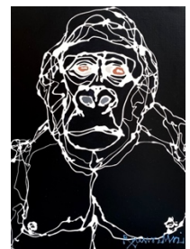
Gorilla/ Masking medium and acrylic on canvas / h72.7×w53×d3cm / 2022