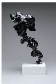
律動2021.2 / Lacquer, cloth, coating powder / h67×w35×d25cm / 2021