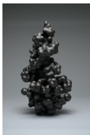
増殖2022.2 / Lacquer, cloth, coating powder / h63×w35×d35cm / 2022