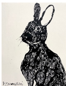
Rabbit/ Enamel, Japanese paper on panel / h53×w41×d3cm / 2023