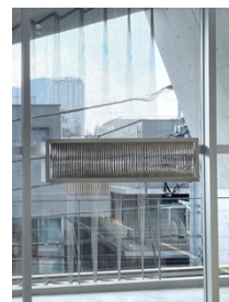
115 vertical lines in the frame_#001 / Stainless steel, aluminum, rubber / h35.5×w124.5×d6cm / 2021